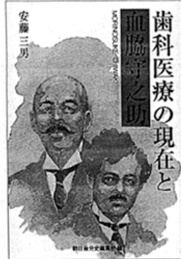
『歯科医療の現在と血脇守之助』 四六判/228ページ/1,200円(税別)/三栄会出版部 TEL03(3923)6500

と歯科医師との社会的地位の格差が大きく、歯科医師が社会に認められるためには「社会に通用する品格を持った人間になることだ」と血脇は願った。